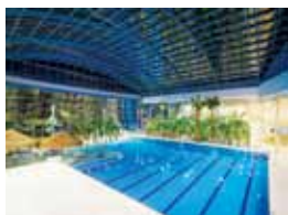
50 SUNTAGO. TROPKI PRZEZ OKRĄGŁY ROK