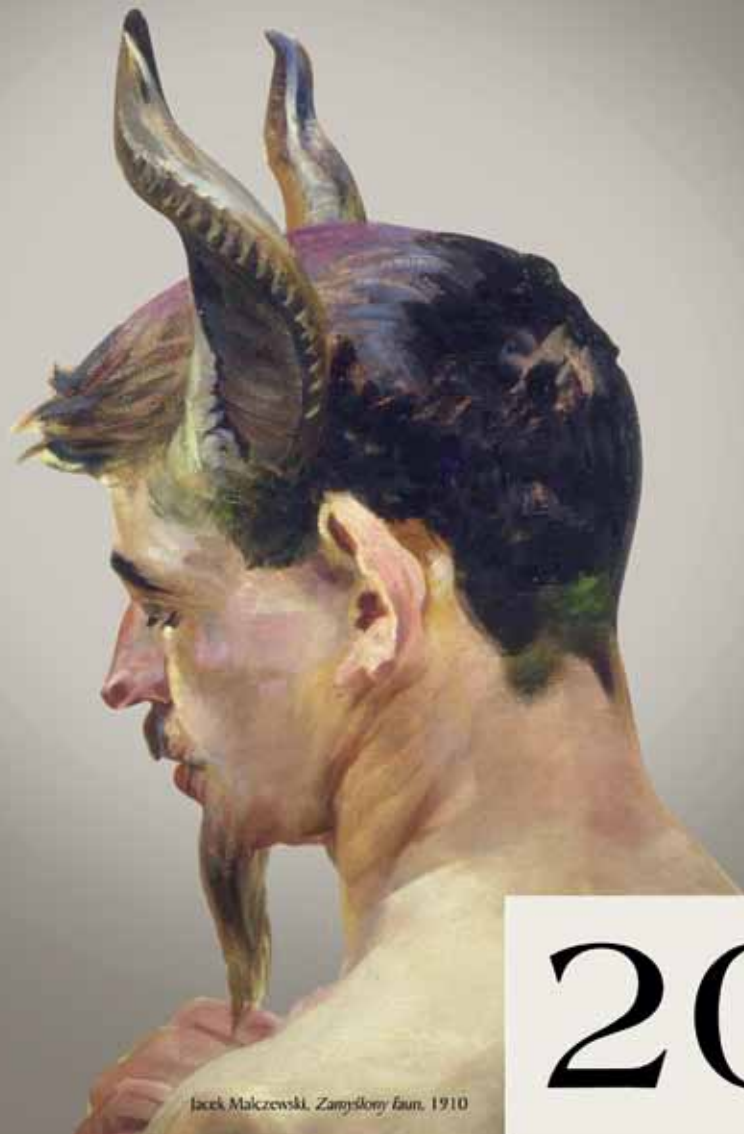
Jacek Malczewski, Zamyślony faun , 1910