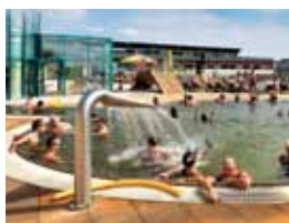
40 TERMY MSZCZONÓW I OKOLICE