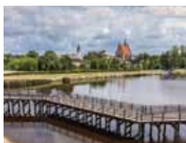
40 ZALEW SZYDŁOWIECKI