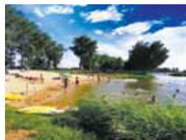
6 ZALEW WĘGROWSKI