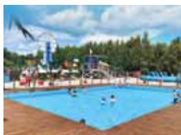
52 FARMA ILUZJI. NAUKA JAK ZABAWA I MNÓSTWO WODY DLA OCHEŁODY