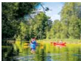
20 SKRWA. RZEKA DLA NAJTWARDZYSZYCH