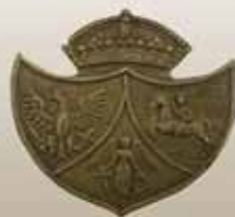
► Broska z okresu sukcesji narodowej, 1861-1862