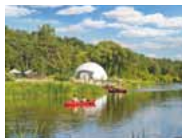
16 WKRA. ŻWAWA, KRĘTA I MAŁOWNICZA