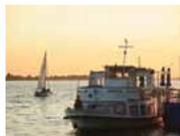
22 JEZIORO WŁOCŁAWSKIE