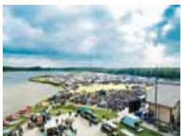
14 PLAŻA KURPIOWSKA KRAINA