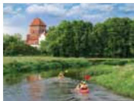
8 LIWIEC. RODZINNY WYPOCZYNEK I PIĘKNE WIDOKI