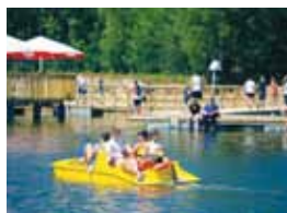
46 ZALEW ŻYRARDOWSKI