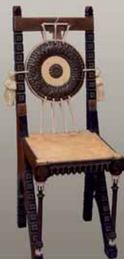
► Cień Bogactwa, Lippold z kompletem mebli, ok. 1900