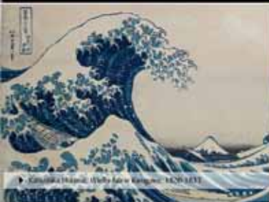
► Katsushika Hokusai, Wielka fala w Kanagawie , 1829-1833