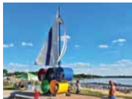
4 ZALEW NAD MUCHAWKĄ