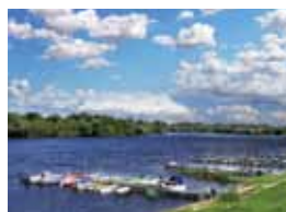
26 NAREW. WODNE SPLOTY, STARORZECZA I ZALEW