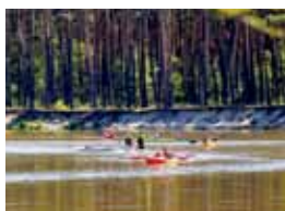
28 BUG. CICHA WODA GRANICZNA