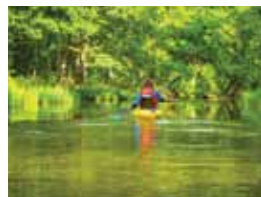
12 OMULEW.. PRZEZ KURPIE ZIELONE DO NARWI