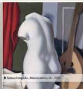
► Tosia i komplekty, Albina natka , ok. 1950