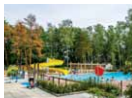
34 WARSZAWSKIE KĄPIELISKA