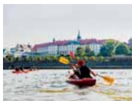
38 WEŻ ODDECH NAD WISŁĄ, CZYLI WAKACJE W WARSZAWIE