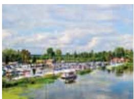
24 JEZIORO ZEGRZYŃSKIE