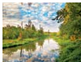
44 JEZIORKA. WYDMOWE PAGÓRKI I PUŁAPKI BOBRÓW